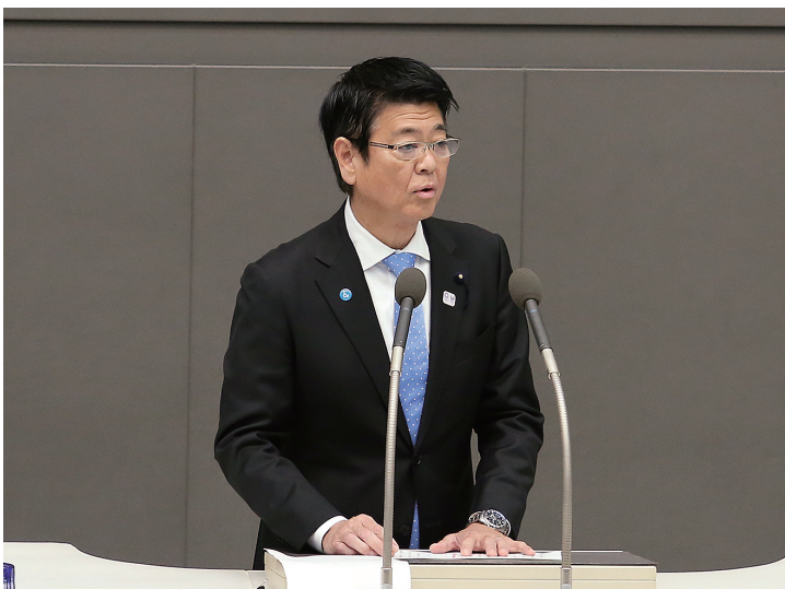
都議会第四回定例会で

都議会自民党の政策責任者でもある私の代表質問は、昨年12月7日に行われました。これは質問の際にもふれたことですが、森記念財団が毎年公表している世界都市ランキングで、東京はパリを抜いて3位となり、2020オリンピック・パラリンピック開催都市として国際的な評価を益々高めています。しかし、その一方、少子化対策などさまざまな課題を抱えているのも事実です。